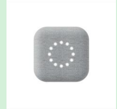
『BoTトーク』 ピーサイズ株式会社 【神奈川県】