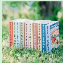
『木のえほん』 株式会社ヒョウデザイン 【鳥取県】