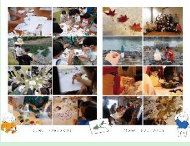
『まちいろクレヨン探検隊』 一般社団法人アーバンデザインセンター宇治 / 宇治市政策企画部政策戦略課 / 慶應義塾大学SFC石川初研究室 【京都府】