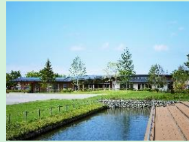
『パッシブタウン第4街区 たんぼぼ保育園』 YKK不動産株式会社 / 株式会社田口知子建築設計事務所 / 株式会社竹中工務店 【富山県】