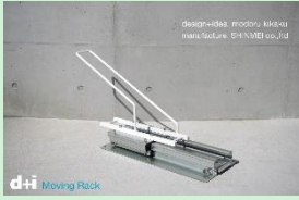
『入庫も出庫もラクラク。普段通りに使える駐輪ラック 【Moving Rack】』 有限会社モドルキカク / 株式会社伸明 【大阪府】