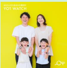
『おもちゃから生まれた腕時計「YOT WATCH (ヨットウォッチ)」』 株式会社三栄コーポレーション 【東京都】