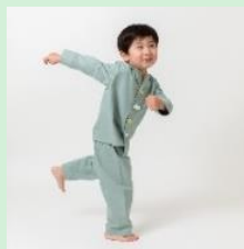
『i do button』 株式会社Discovery Kids 【東京都】