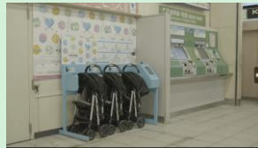
『ベビカル』 JREベビーカーシェアリング有限責任事業組合 (東日本旅客鉄道株式会社 / 株式会社ジェイアール東日本企画) 【東京都】