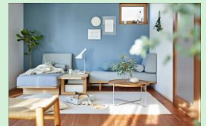
『～子育て世代へ LIFE IDEASを盛り込んだ住まい提案～ 積水ハウス ノイエ』 積水ハウス ノイエ株式会社 / 積水ハウス株式会社 【大阪府】