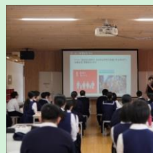
『「ALL FOR THE NEXT」次世代へ紡ぐ小国町の新しいまちづくり』 法政大学デザイン工学部川久保俊研究室 / 熊本県小国町 【東京都】