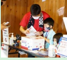
『子ども向け郵便局の職業体験イベント「みんなの郵便局」』 日本郵便株式会社 【東京都】