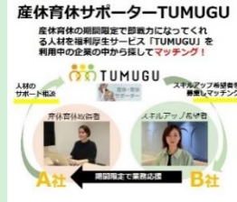
『産休育休サポーターTUMUGU』 株式会社QOOLキャリア 【東京都】