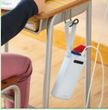
『学校向けリン酸鉄モバイルバッテリー』 エレコム株式会社 【大阪府】