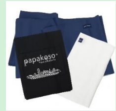
『濱帯 (はまおび)』 株式会社ワンスレッド 【神奈川県】