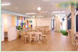
『みらいをつくる Miracle Labo』 株式会社パソナフオスター 【東京都】