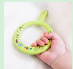
『POSYリング歯ブラシ』 ファイン株式会社 【東京都】