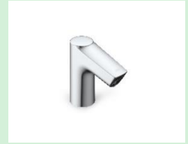
『乾電池式オートマージュ台付タイプ』 株式会社LIXIL 【東京都】