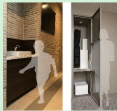
『分譲マンションにおける子育て支援サービスの提案』 積水ハウス株式会社 【大阪府】