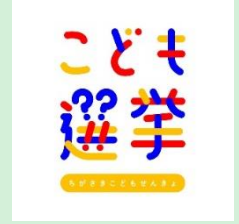
『こども選挙』 こども選挙実行委員会 【神奈川県】