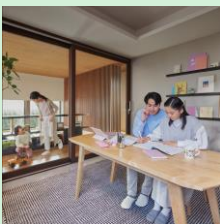
『音の自由区』 大和ハウス工業株式会社 【大阪府】