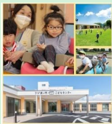
『「一つ屋根の下で一緒に過ごす！」フジ虎ノ門こどもセンター』 社会医療法人 青虎会 / 積水ハウス株式会社 【静岡県】