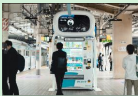
『エキマトベ』 富士通株式会社 【東京都】