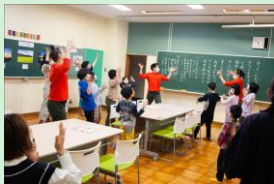
『創作ダンスで校歌を残すプロジェクト』 んまつーボス / 対馬博物館 / 宮崎大学発ベンチャー企業 一般社団法人namstrops 【宮崎県】