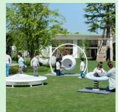
『RESILIENCE PLAYGROUND』 株式会社ジャクエツ / 一般社団法人Orange Kids'Care Lab. 【福井県】