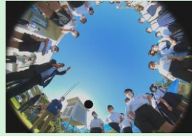
『未来の山口の授業 at school』 山口情報芸術センター [YCAM] / 山口市教育委員会 【山口県】