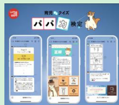
『育児クイズパカ検定』 株式会社Mama's Sachi 【東京都】