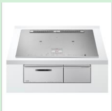
『IHクッキングヒーターNシリーズ』 日立グローバルライフソリューションズ株式会社 【東京都】