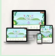
『障がいや病気の兄弟姉妹がいる子どものきょうだい向けの情報サイト「うるるしぶ」』 任意団体うるるしぶ 【東京都】