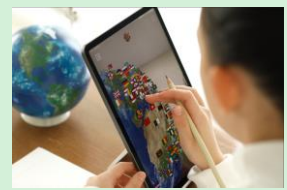
『ほぼ日のアースボール』 株式会社ほぼ日 【東京都】