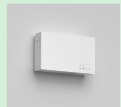
『子どもたちに安心・安全な空気を提供する「ヘルスエアー機能付き大風量循環ファン」』 三菱電機株式会社 【東京都】