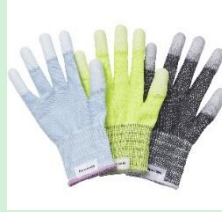
『タングステン耐切削手袋』 パナソニック ライティングデバイス株式会社 【大阪府】