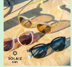
『SOLAIZ Kid's』 株式会社エリカオプティカル 【福井県】