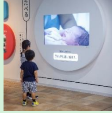
『ユニセフハウス』 公益財団法人日本ユニセフ協会 【東京都】