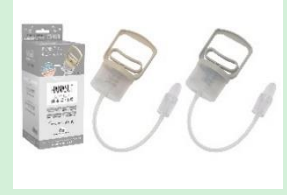
『【日本製】手動ポンプ式鼻水吸引器 HANASUI』 HANASUI株式会社 【京都府】