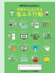
『脱炭素型ライフスタイル推進 省エネナッジ教育』 東京ガス株式会社 / 株式会社住環境計画研究所 【東京都】