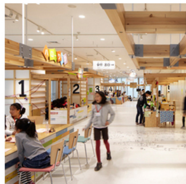
静岡市こどもクリエイティブタウン 『ま・あ・る』による 「しごと・ものづくり体験」 (株)丹青社/静岡市 »詳細はこちら