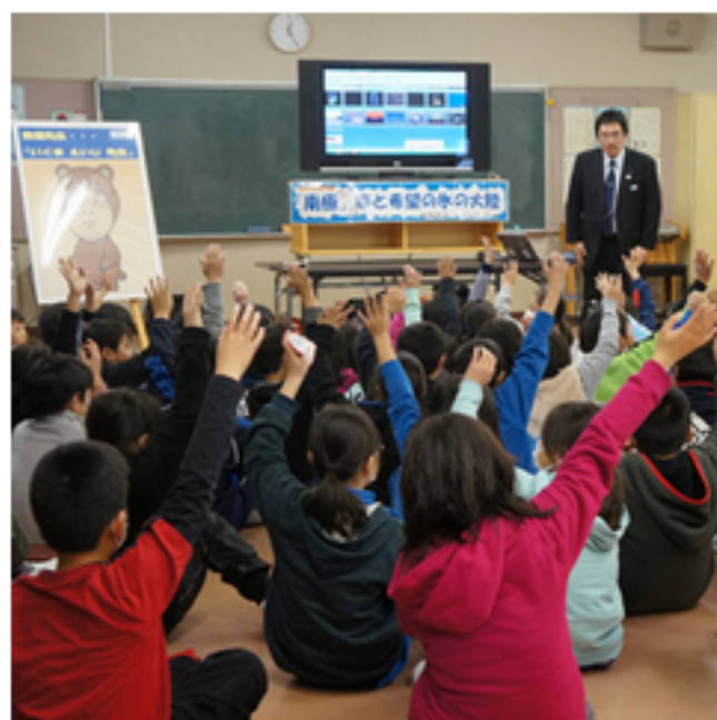
南極クラス ミサワホーム(株) 他36団体 »詳細はこちら