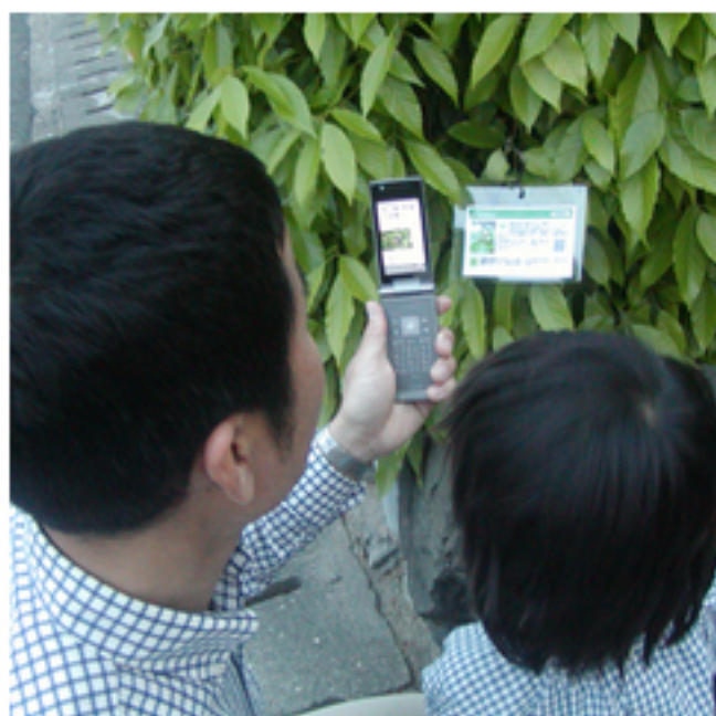
「5本の樹」野鳥ケータイ図鑑 積水ハウス(株) »詳細はこちら