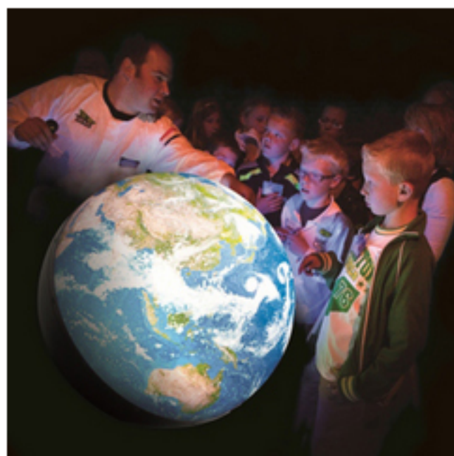
「触れる地球」中型普及版 (株)JVCケンウッド NPO法人Earth Literacy Program »詳細はこちら