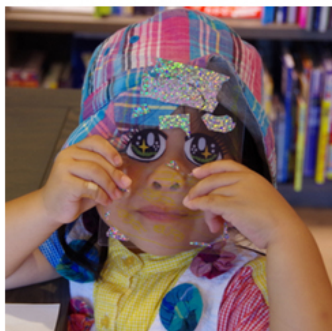
かおレイヤー hello-toys »詳細はこちら