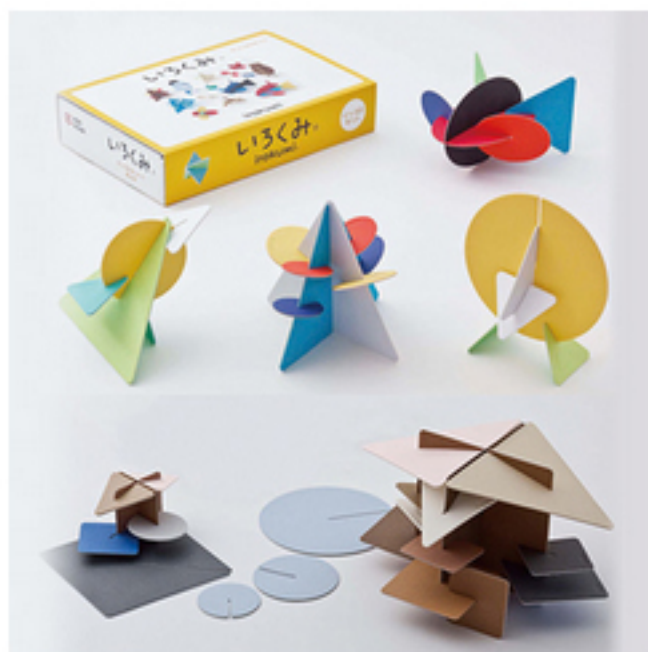
いろいろみ (株)スタジオピーパ »詳細はこちら