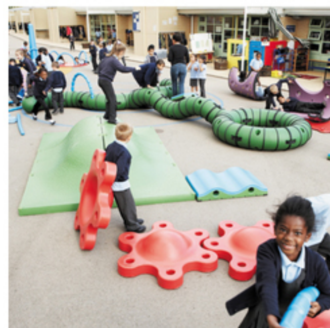
想像力と創造力で遊ぶ! 新・コンセプト道具「スナッグ」 (株)コトブキ »詳細はこちら