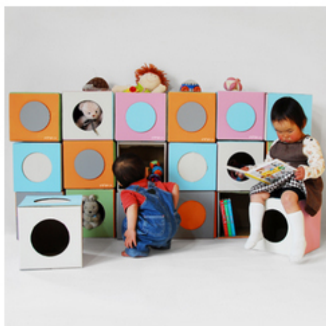
ソダツハコ sodatsu factory »詳細はこちら