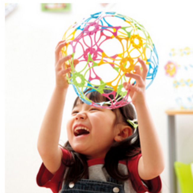
ワミーシリーズ コクヨS&T(株) »詳細はこちら